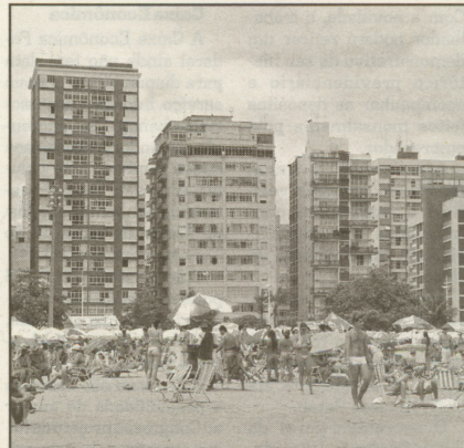
Regras ajudam a manter o respeito entre turistas e moradores