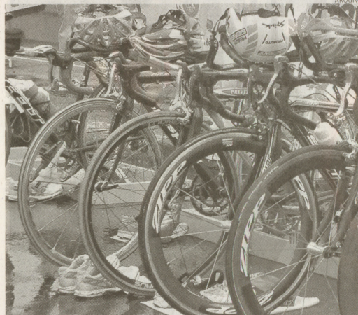
Oito bicicletas foram levadas por ladrões em menos de uma semana

O local considerado mais perigoso é o trecho da rodovia Cônego Domênico Rangoni, no distri-